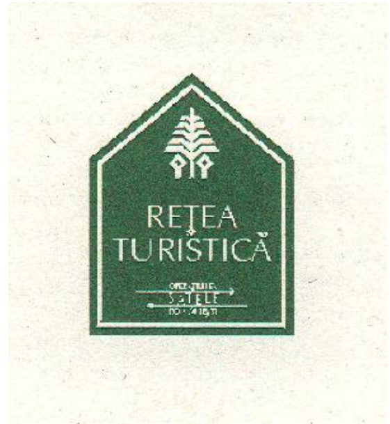
Panonceau à l'entrée du village